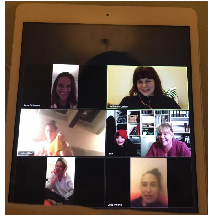
Bsp. privates virtuelles Treffen mit Freundinnen